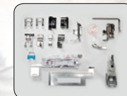
PROFITEZ DE LA GRANDE VARIÉTÉ DES 16 PIEDS PRESSEURS