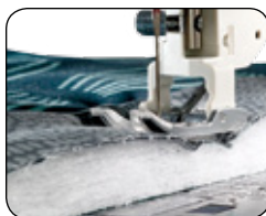
SYSTÈME D'ALIMENTATION DU TISSU ACUFEED FLEX TM: PIQUE AUSSI ÉPAIS QUE VOUS LE VOULEZ