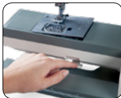
RAPIDE CHANGEMENT DE LA PLAQUE D'AIGUILLE EN UN ÉTAPE