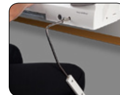
RELEVEZ LE PIED DE BICHE SANS VOUS SERVIR DE VOS MAINS