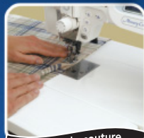
Surface de couture extravagante