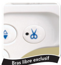
Bras libre exclusif