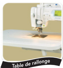
Table de rallonge