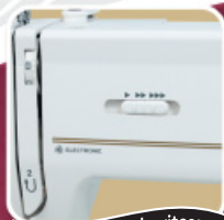
Commande de la vitesse