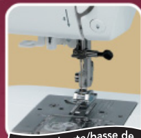
Contrôle haute/basse de la position de l'aiguille