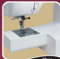
Couture bras libre