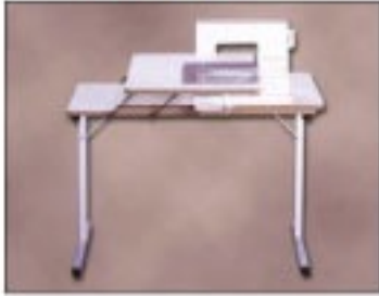
TABLE DE COUTURE PLIANTE A POSITION BRAS LIBRE ET À PLAT